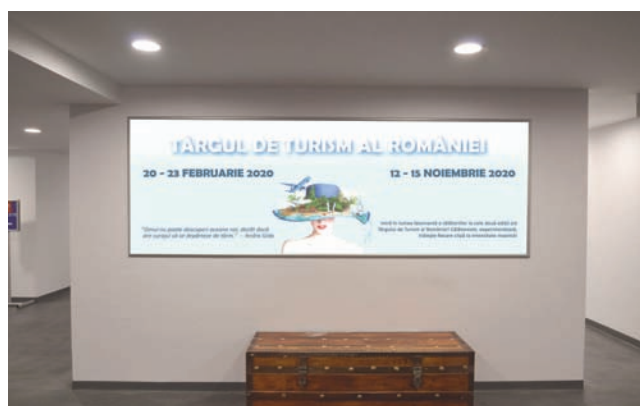
CASETA CU RAMA CLICK, DIMENSIUNE 320X110 CM