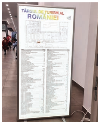
AFISARE POSTER PE TOTEM ILUMINAT CU MODULE LED, DIMENSIUNE 100X200 CM