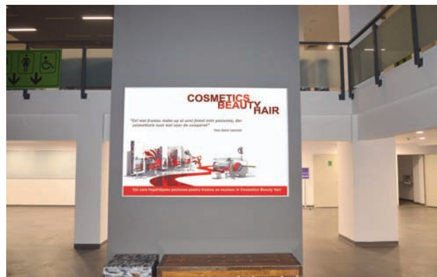
CASETA CU RAMA CLICK, DIMENSIUNE 200X140 CM