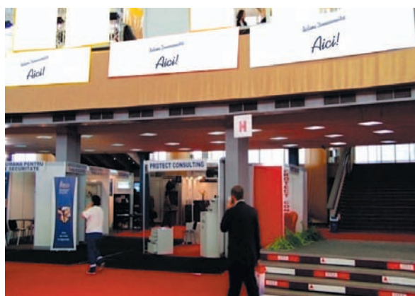
AFISARE BANNERE PAVILION A, FRIZA 4.50